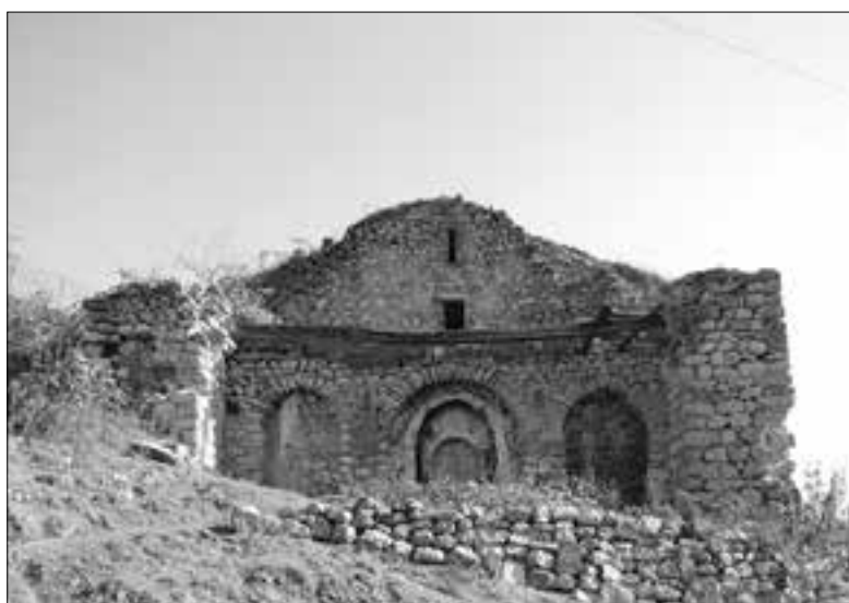
ԼՈՒՍՏԱՆԱԳՐԸ Ա. ԿԱՊԵՍՅԱՆԻ

Ծնվել է 1969թ. Վերին Խոտանան գյուղում: Ութամյա ավարտել է տեղի դպրոցում, այնուհետեւ ավարտել Կապանի N7 միջն. դպրոցը (մաթեմատիկական թեթևակ դասարան): 1986թ. ընդունվել է Երեւանի պոլիտեխնիկական ինստիտուտի մեքենաշինության էկոնոմիկայի բաժինը, հետո գորակոչվել խորհրդային բանակ, ծառայել Ադրբեջանում, 1993թ ավարտել ինստիտուտն ու վերադարձել գյուղ: Մեկ տարի ռազմագիտության ուսուցիչ է աշխատել Վ.Խոտանանի միջնակարգ դպրոցում: 1994թ. ղեկավարեցին ընտրվել է Վ.Խոտանանի գյուղխորհրդի նախագահ, ՀՀ-ում համայնքների ձեւավորումից հետո՝ գյուղապետ՝ մինչ օրս: ՀՀԿ անդամ է: Ամուսնացած է, ունի երեք դուստր: